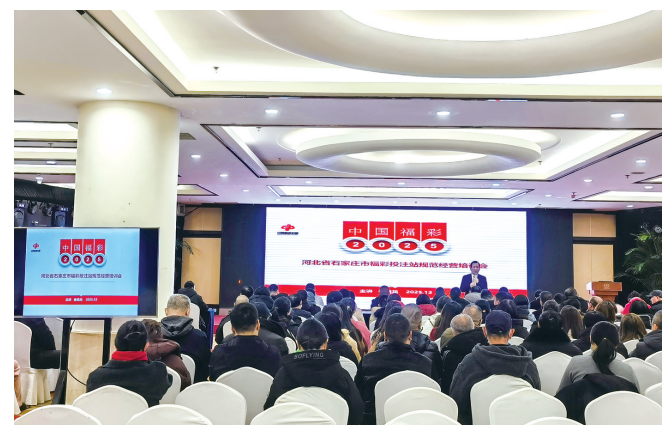
石家庄福彩责任彩票和安全销售培训会现场。