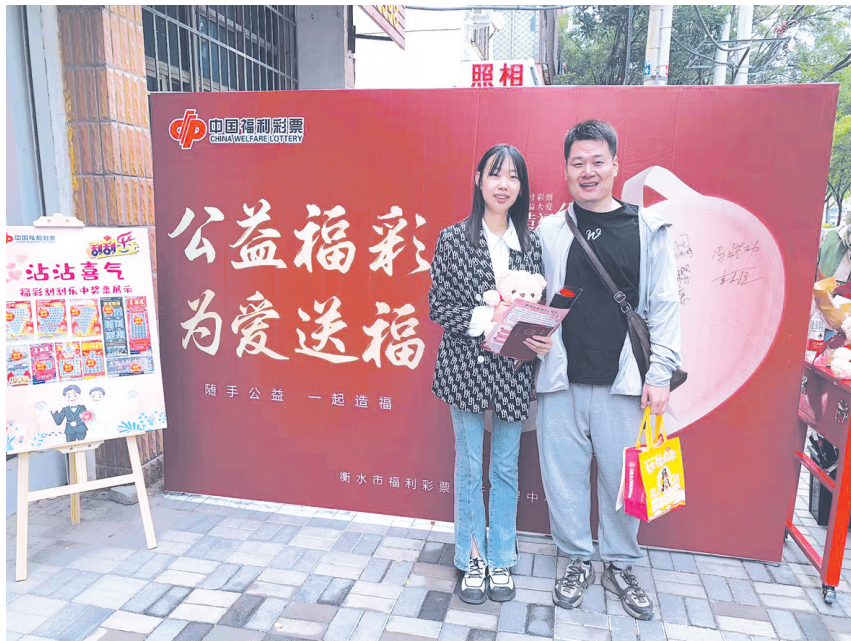
5月20日,衡水福彩开展“公益福彩 为爱送福”主题活动。

7月17日至8月23日,衡水福彩开展“始于公益 忠于初心”系列公益活动之“公益福彩 清凉一夏”活动,此次活动覆盖了主城区主干道的40家“爱心驿站”。每家“爱心驿站”依托现有福彩销售网点,在店面显眼位置张贴爱心驿站标识,方便需要帮助的人能够迅速找到