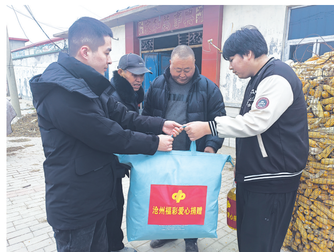
沧州福彩工作人员走访慰问福彩助学受助生亲属。

12月10日,沧州市福彩中心工作人员来到沧州市海兴县张会亭镇北台村走访慰问福彩助学受助生亲属,并为他们送去过冬的棉被、米、面、油等生活用品。