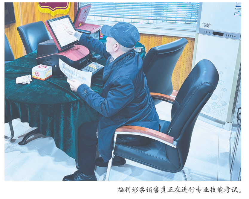
福利彩票销售员正在进行专业技能考试。