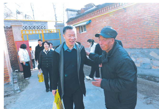
保定市福彩中心工作人员来到高碑店市所辖行政村，走访慰问“福彩暖冬”资助对象。