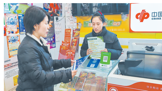
保定市福彩中心把福彩销售网点变身成“救助小屋”。